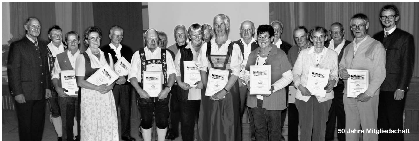
50 Jahre Mitgliedschaft