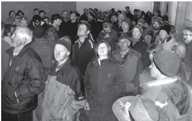
Eine große Anzahl Teilnehmer folgte interessiert den Ausführungen der Referenten im Betrieb Metz, Untermaiselstein