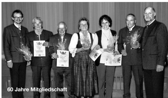
60 Jahre Mitgliedschaft