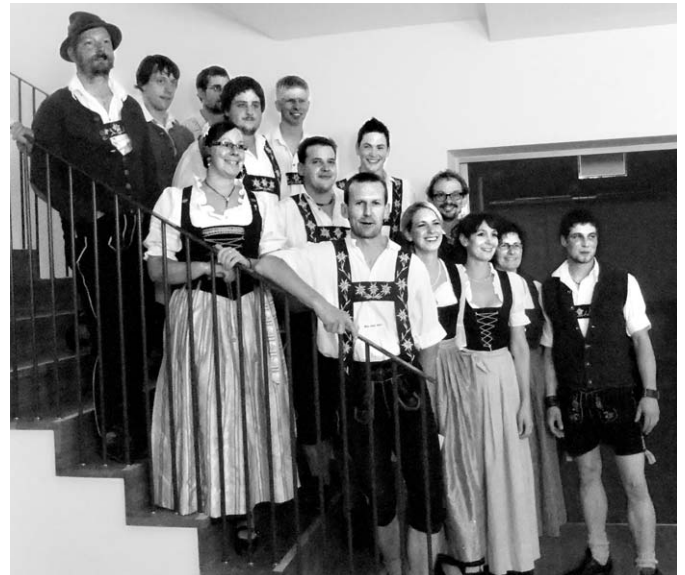
Abschlussklasse Alpwirtschaftsakademie 2011

Neu begonnen hat die Akademie mit dem Jahrgang 2011/2013 mit 28 Teilnehmerinnen und Teilnehmern.