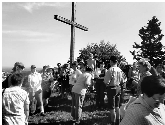
Eine verdiente Pause an der Martinshöhe gönnten sich die Teilnehmerinnen und Teilnehmer beim Familienwandertag

Auf schattigen Wanderwegen ging es weiter durch eine abwechslungsreiche Landschaft mit Wald, Wiesen und Mooren zum »Kalten Brunnen«. Der Waldanteil hat auf dem Höhenrücken des Hochsträß in den letzten 50 Jahren sehr zugenommen. So wurde z.B. eine Fläche von 10 ha, einst als Viehweide genutzt, von einem Nicht-Landwirt angekauft und komplett mit reinem Fichtenbestand angepflanzt. Eine weitere Anpflanzung verdeckt eine schöne Sicht, die man einst bis zum Alpsee bei Immenstadt hatte.