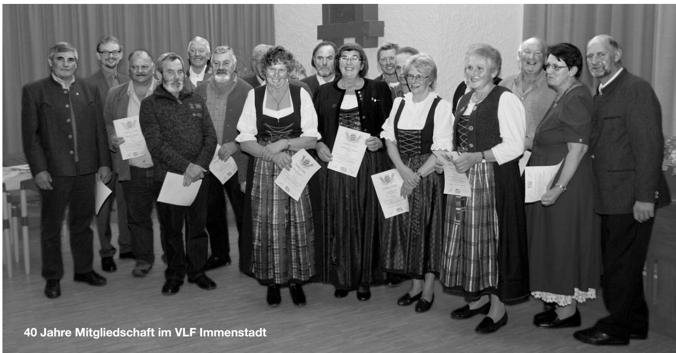
40 Jahre Mitgliedschaft im VLF Immenstadt